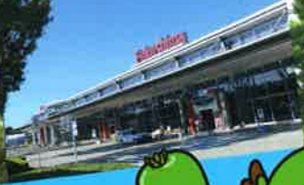
玉川村公認 キャラクター クックちゃん